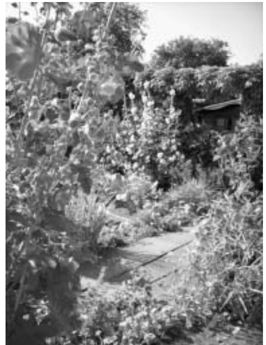
Stockrosen im Garten - bunte Pracht unter hegender Hand