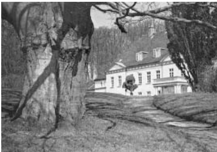
Louisenlund. Park und Rückseite des Herrenhauses

In diesem Zusammenhang möchte ich nicht versäumen, noch einmal auf weitere interessante Einzelveranstaltungen der VHS im Frühjahr hinzuweisen: