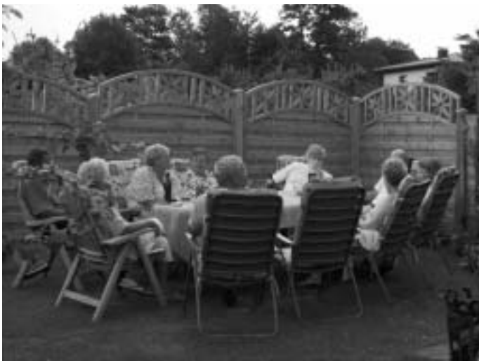
Auch Feste feiern gehört zum Gartenleben.

Wenn Ihnen das noch nicht genügt, dann stelle ich Ihnen die Frage: „Wie kann man seine Freizeit sinnvoller gestalten, als mit Freizeitbeschäftigung auch noch für seinen gesunden Lebensunterhalt zu sorgen und bis ins hohe Alter fit zu bleiben??!!!“