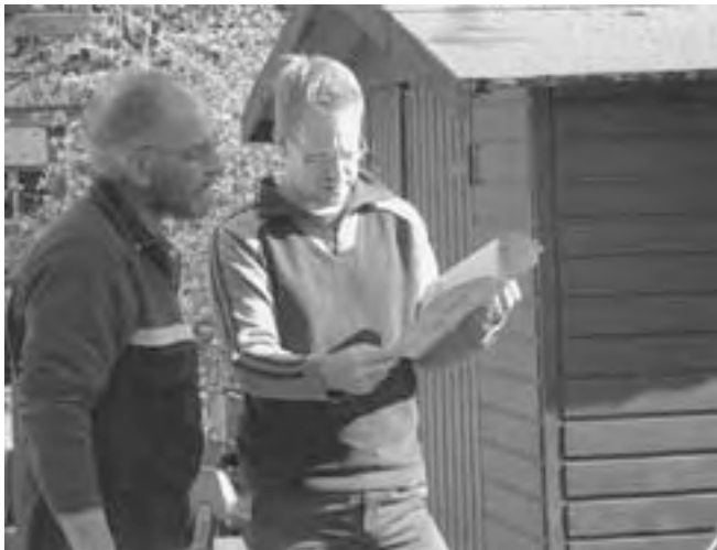
Bauanleitung - ohne geht's nicht!