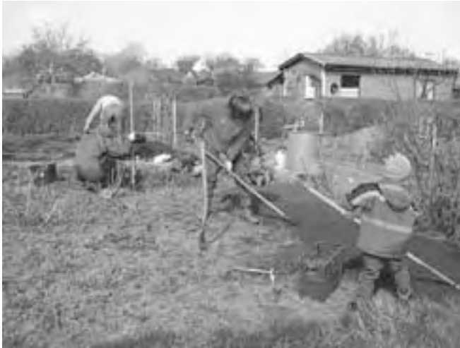
Es gibt viel zu tun, packen wir's an!