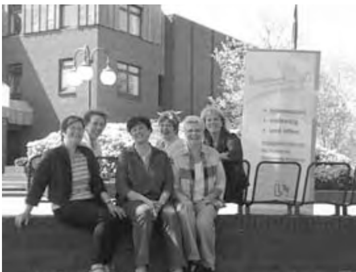
Der gesamte Vorstand