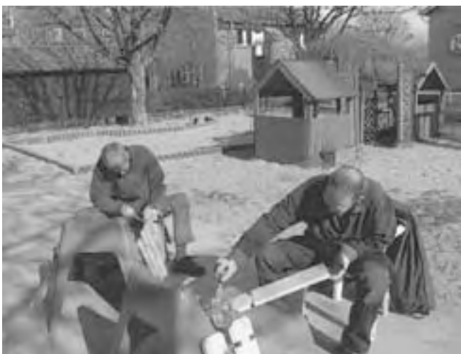
... und wir pinseln schon mal!