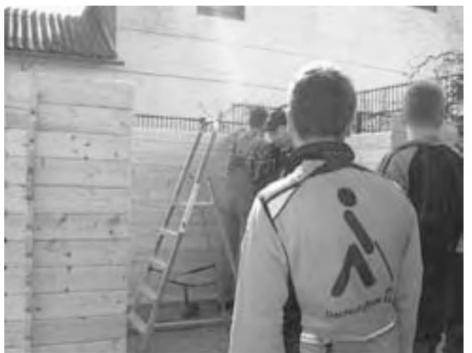
Sieht schon richtig gut aus!