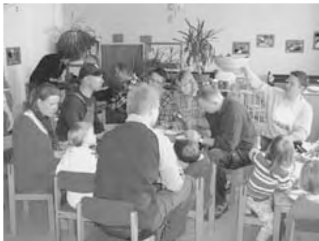
Nach getaner Arbeit schmeckt's allen!