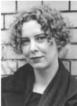
Katharina Hacker (Jahrgang 1967).

Gegenstand der Lektüre und unseres Gesprächs ist der 2006 im Suhrkamp-Verlag erschienene Roman „ Die Habenichtse “ der deutschen Schriftstellerin