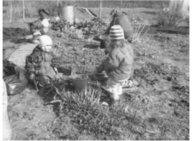
Ist das nun Unkraut oder 'ne Blume?