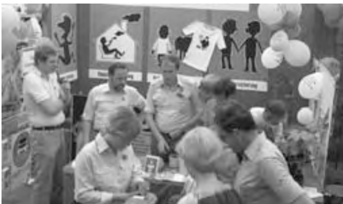
Erstes Harrisleer Schaufenster 1978

Bereits vor über 30 Jahren haben sich Gewerbetreibende in Harrislee zu einem Interessenverband zusammengeschlossen: 1976 gründeten einige örtliche Kaufleute die Werbegemeinschaft Harrislee. Drei Jahre später ging daraus die Interessengemeinschaft Harrisleer Unternehmen , kurz IHU genannt, in der Rechtsform eines eingetragenen Vereins hervor.