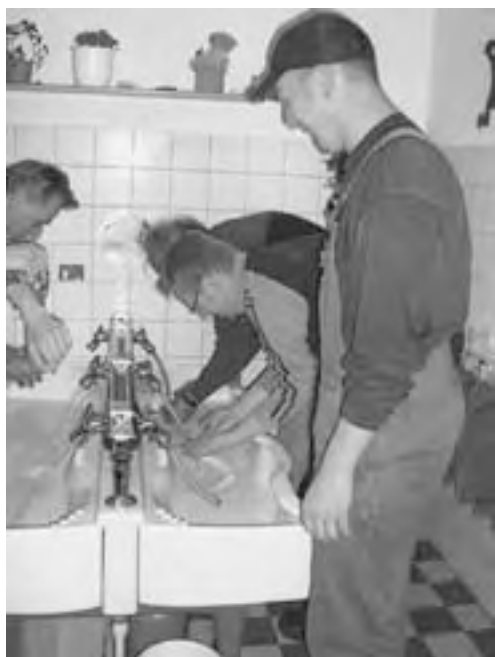
Händewaschen auf niedrigem Niveau