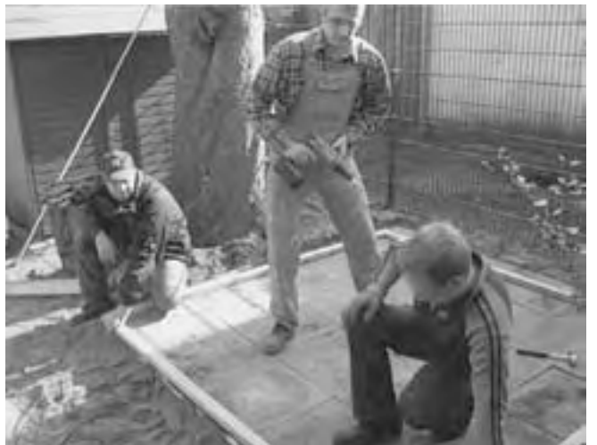
Ich bohr schon mal!